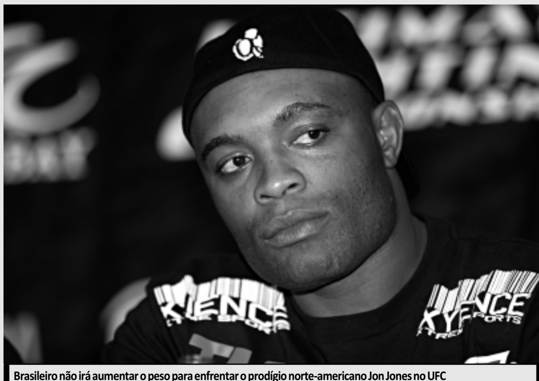
Brasileiro não irá aumentar o peso para enfrentar o prodígio norte-americano Jon Jones no UFC

Na mesma entrevista, o recordista de vitórias seguidas no evento americano comentou a recepção brasileira após o nocaute aplicado