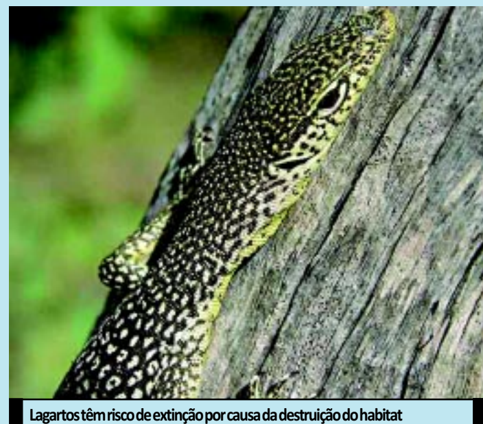
Lagartos têm risco de extinção por causa da destruição do habitat

Para criar programa de proteção imediato que garanta a sobrevivência dos animais, seriam necessários 96 milhões de dólares australianos (cerca de R$ 161 milhões). Já as ações em Kimberley demandariam mais 40 milhões de dólares