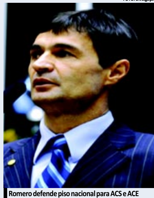
Romero defende piso nacional para ACS e ACE

Conforme Romero, a União deverá assegurar através dos seus recursos, assistência financeira complementar aos estados, ao Distrito Federal e aos municípios, para o cumprimento do piso salarial.