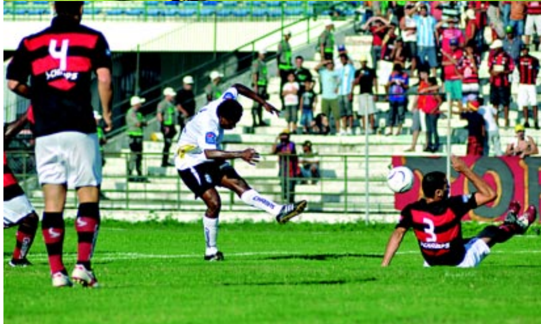
Os principais clubes do Estado como Botafogo, acima, Campinense e Treze ainda dependem da documentação para a liberação dos recursos do programa. Apenas CSP e Miramar já estão usufruindo do dinheiro