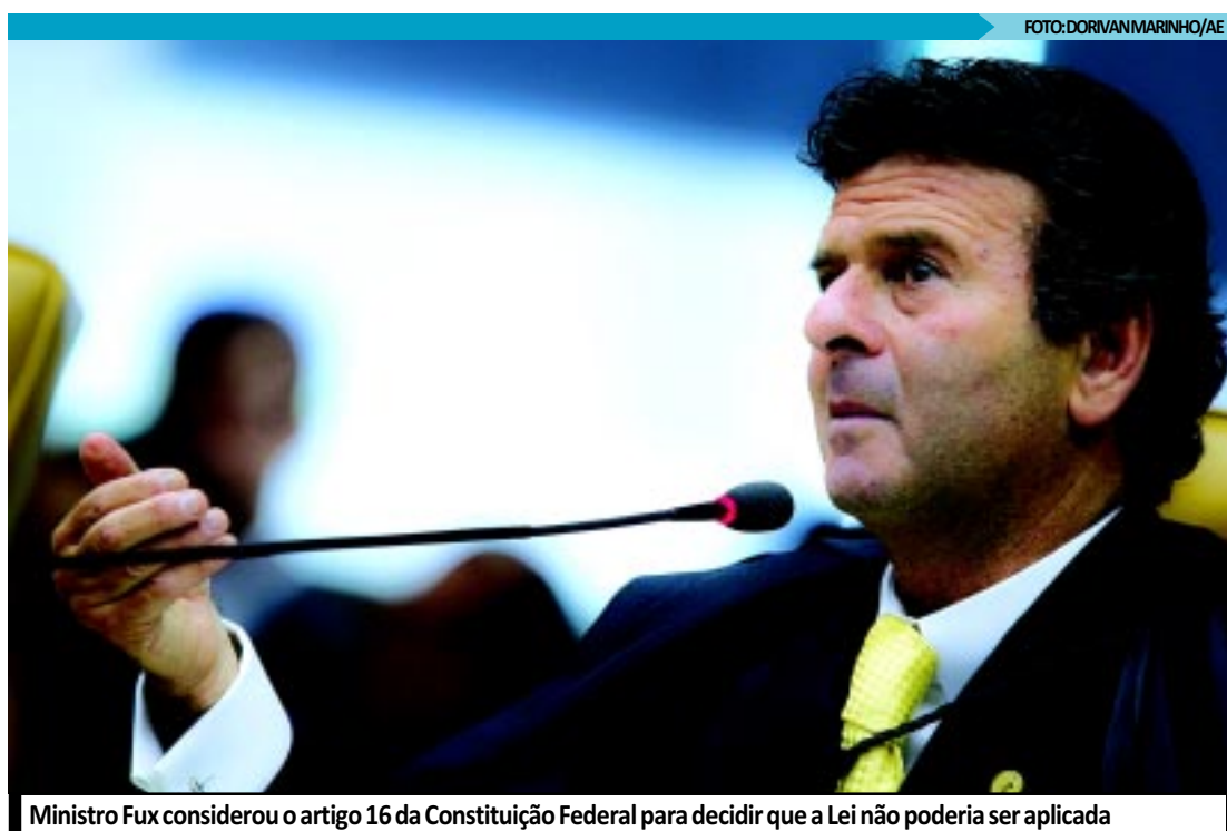
Ministro Fux considerou o artigo 16 da Constituição Federal para decidir que a Lei não poderia ser aplicada

Relator do recurso julgado ontem, movido pelo candidato a deputado estadual Leonídio Bouças (MG), condenado por improbidade administrativa, o ministro Gilmar Mendes concentrou o seu voto no argumento de que a lei alterou o pro-