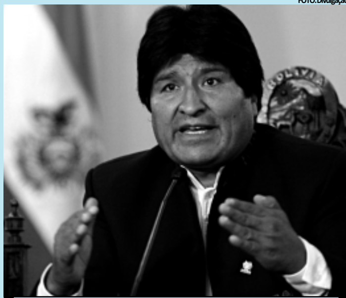
Morales disse que continuará as negociações bilaterais com o Chile

"A comunidade internacional deve entender que chegou o momento de que