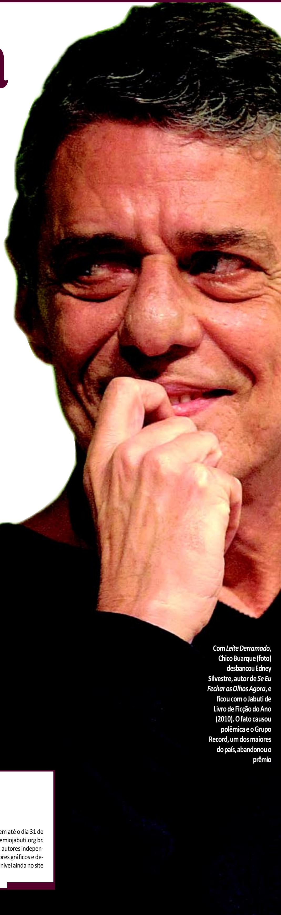
Com Leite Derramado , Chico Buarque (foto) desbancou Edney Silvestre, autor de Se Eu Fechar os Olhos Agora , e ficou com o Jabuti de Livro de Ficção do Ano (2010). O fato causou polêmica e o Grupo Record, um dos maiores do país, abandonou o prêmio

De acordo com novo regulamento, serão anunciados dez selecionados de cada uma das 29 categorias no dia 13 de setembro. Já o anúncio dos 29 finalistas acontece no dia 18 de outubro. E no dia 30 de novembro sai o vencedor de Livro do Ano, que receberá R$ 30 mil. A CBL espera que neste ano as inscrições passem de 3 mil. Em 2010, foram 2.867 inscritos.