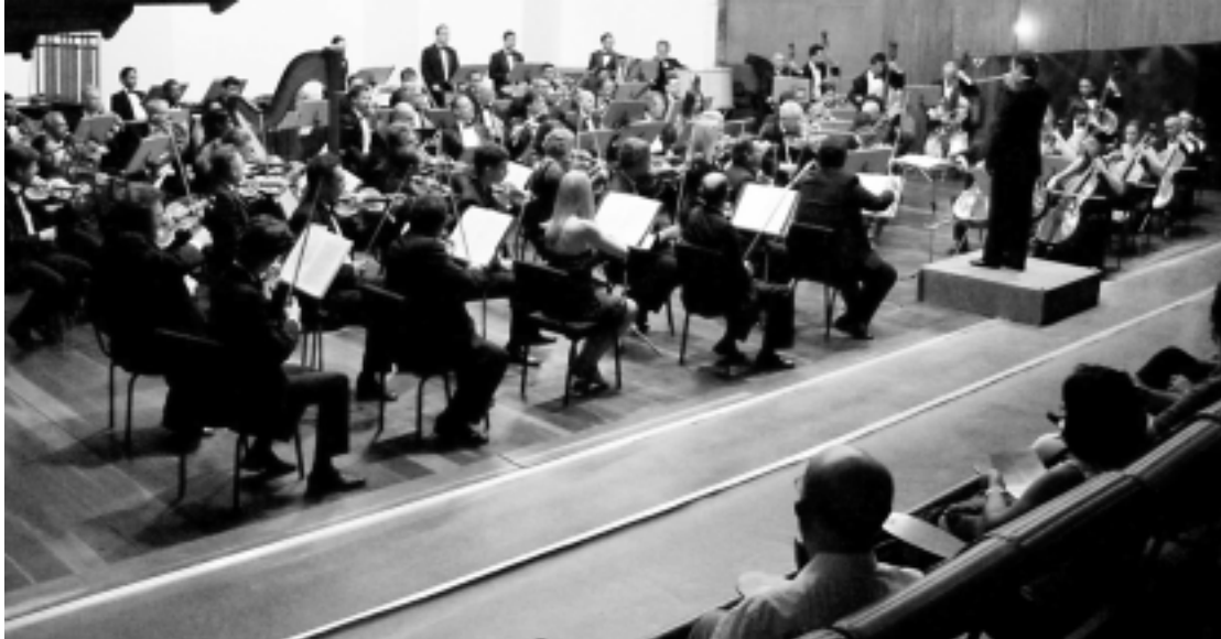
O concerto da Orquestra Sinfônica da Paraíba começa às 9h, no Cine Teatro Bangüê, e será aberto ao público