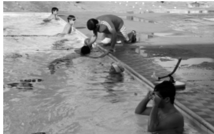
Fora do futebol desde 1942, clube só cuida dos esportes olímpicos