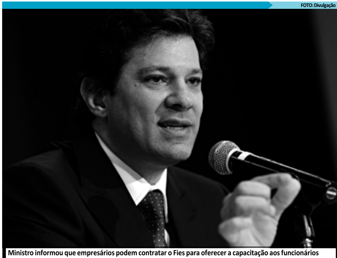
Ministro informou que empresários podem contratar o Fies para oferecer a capacitação aos funcionários

Com isso, mais 3,6 milhões de beneficiários no Estado passarão este ano a atualizar seus dados anualmente na rede bancária.