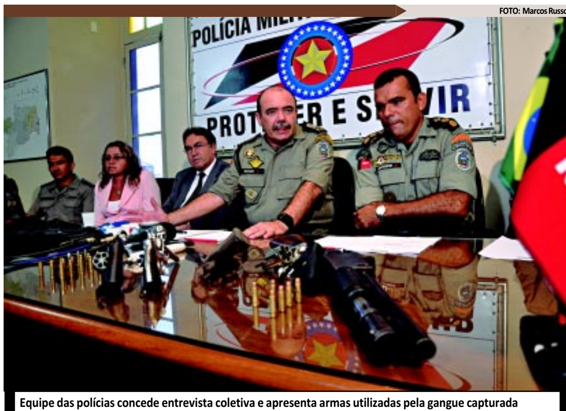
Equipe das polícias concede entrevista coletiva e apresenta armas utilizadas pela gangue capturada

Em poder dos acusados, foram apreendidos quatro revólveres calibre 38, munições, uma espingarda calibre 12 e uma banana de dinamite, além de dois coletes à prova de balas. "Tivemos dois policiais e um dos acusados feridos, devido à troca de tiros. Contudo, fora isso, os direitos humanos foram respeitados e não derramamos nenhuma gota de sangue para efetuar as demais prisões", destacou. Até o início da noite de ontem, os militares feridos no confronto permaneciam internados no hospital e não correm risco de morte. Os dois passaram por cirurgia na noite da terça-feira e o estado de saúde era considerado regular. Os presos seriam encaminhados ao Presídio do Roger, na Capital, assim que os autos fossem lavrados pela delegada. Já os adolescentes ficariam à disposição da Justiça. O inquérito do caso deve ser concluído em 30 dias.