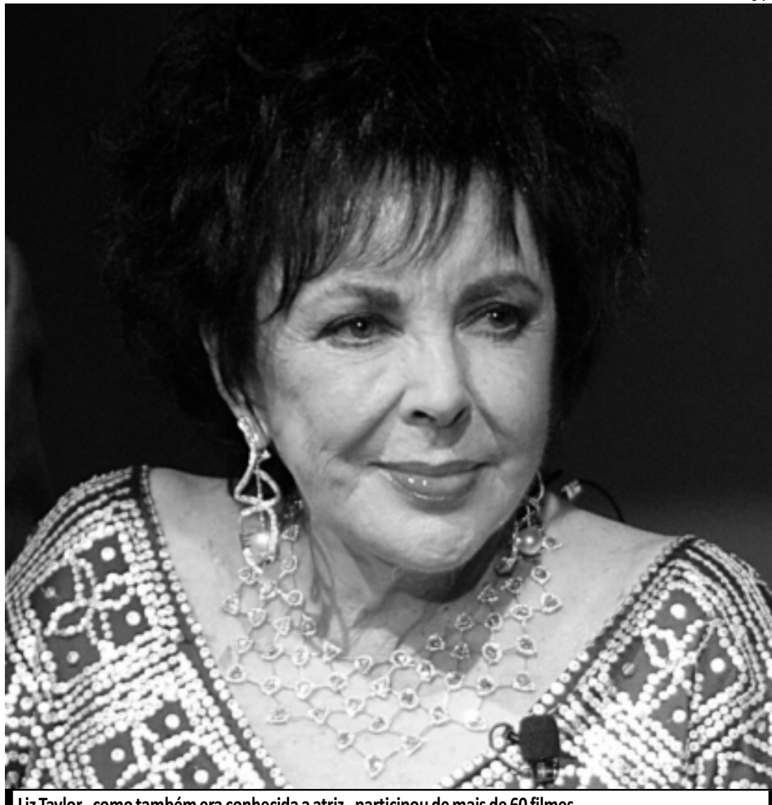
Liz Taylor - como também era conhecida a atriz - participou de mais de 60 filmes

A atriz recebeu o diagnóstico de insuficiência cardíaca congestiva em 2004. Trata-se de uma patologia que impede o coração de bombear sangue oxigenado sufi-