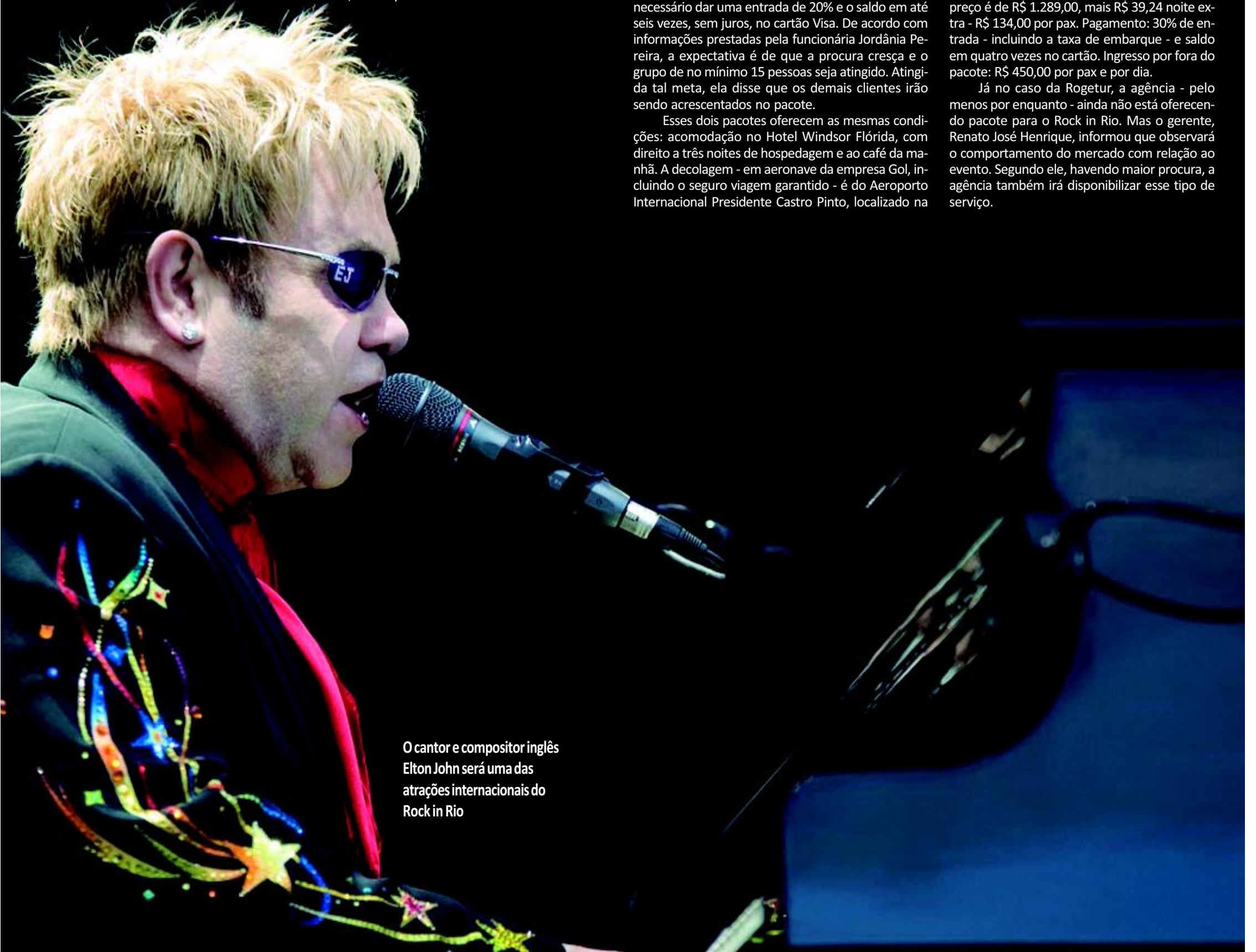
O cantor e compositor inglês Elton John será uma das atrações internacionais do Rock in Rio