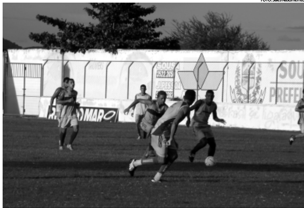
Jogadores do Sousa se empenharam bastante no último treino antes do jogo contra o Miramar