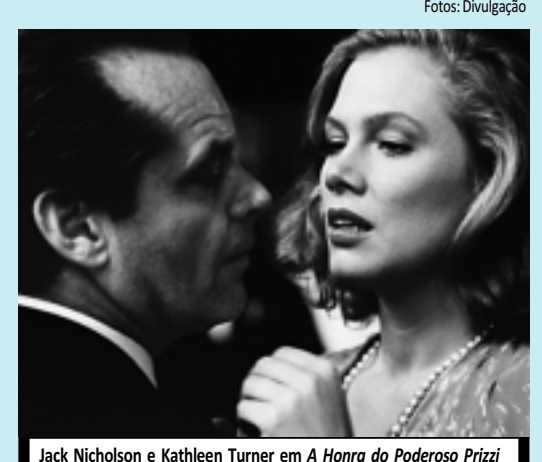
Jack Nicholson e Kathleen Turner em A Honra do Poderoso Prizzi

>>> A HONRA DO PODEROSO PRIZZI - Charley Partanna trabalha como matador para a família Prizzi, a mais tradicional da máfia de Nova York. Irene Walker é uma assassina de aluguel contratada para matar um homem dos próprios Prizzi, que possivelmente os roubou. Logo que se conhecem Charley e Irene se apaixonam. A mulher de um policial morre em um trabalho realizado por Charley, o que faz com que o relacionamento entre a polícia e as famílias de mafiosos seja abalado.