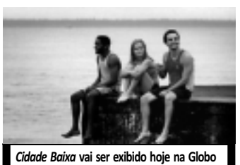
Cidade Baixa vai ser exibido hoje na Globo