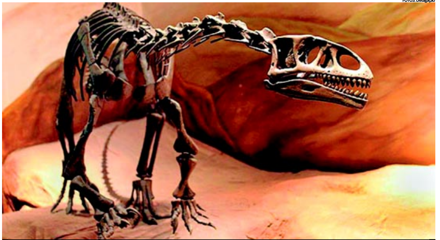
Pequena réplica em museu argentino de como seria o gigante chamado de "Leonerasaurus taquetrensis", cujos fósseis foram encontrados na Patagônia

Como estrelas desse tipo são bem mais comuns do que as do tipo do Sol, é muito provável que possam existir ainda mais "Terras" por aí.