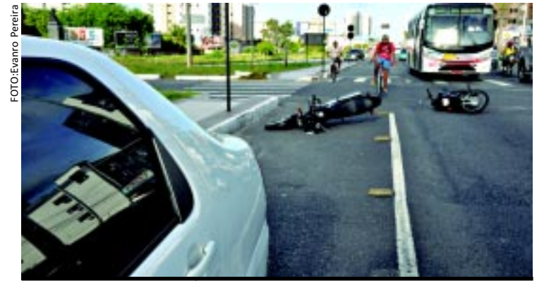
[FOTO&LEGENDA] A imagem não retrata um flagrante ocorrido ontem - e nem precisaria. O acidente envolvendo duas motos no Retão de Manaira é tão comum, infelizmente, que merece o registro como um alerta à prudência no trânsito da Capital. Sempre.