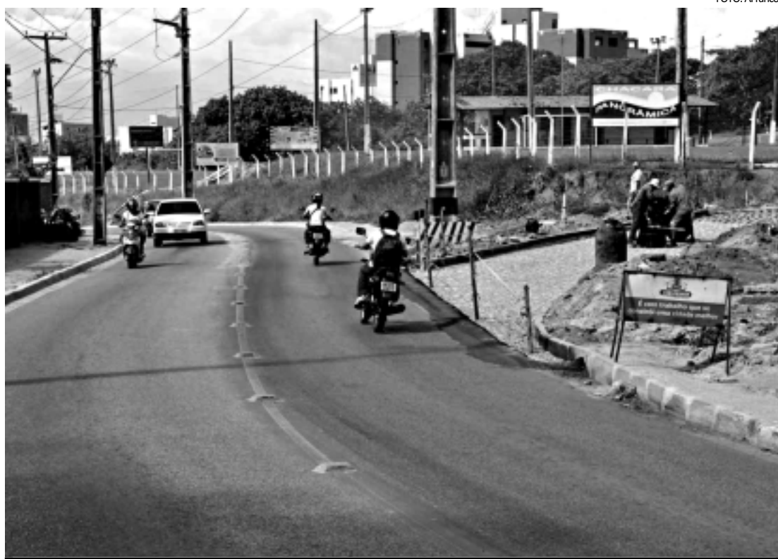
As obras de alargamento da via, orçadas em R$ 1,8 milhão, vão ajudar na melhoria do fluxo de veículos na área

O ACIDENTE - O acidente com o humorista aconteceu na noite do dia 18 de janeiro, na BR -230, nas proximidades da cidade de Campina Grande. O veículo onde estava Shaolin colidiu com um caminhão. O motorista do caminhão está sendo acusado de causar o acidente por ter feito uma manobra indevida. A Polícia Rodoviária Federal informou ainda que o veículo dirigido por Shaolin estava em alta velocidade no momento do acidente.