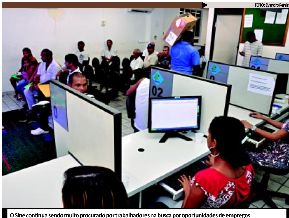
O Sine continua sendo muito procurado por trabalhadores na busca por oportunidades de empregos

O número de pessoas que procura o Serviço Nacional de Emprego tem aumentado consideravelmente, bem como a oferta de emprego por parte das empresas que recorrem ao Sine para o enca-